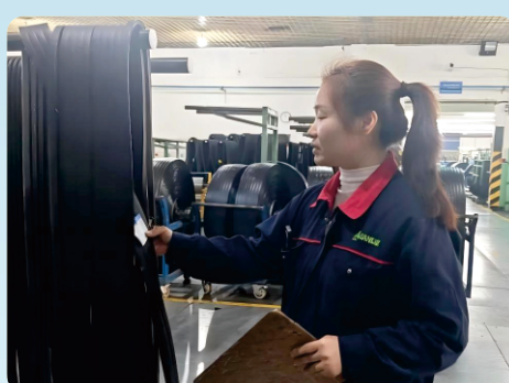
▲ 质量部组织各模块核心行政人员开展平板包布实操考试